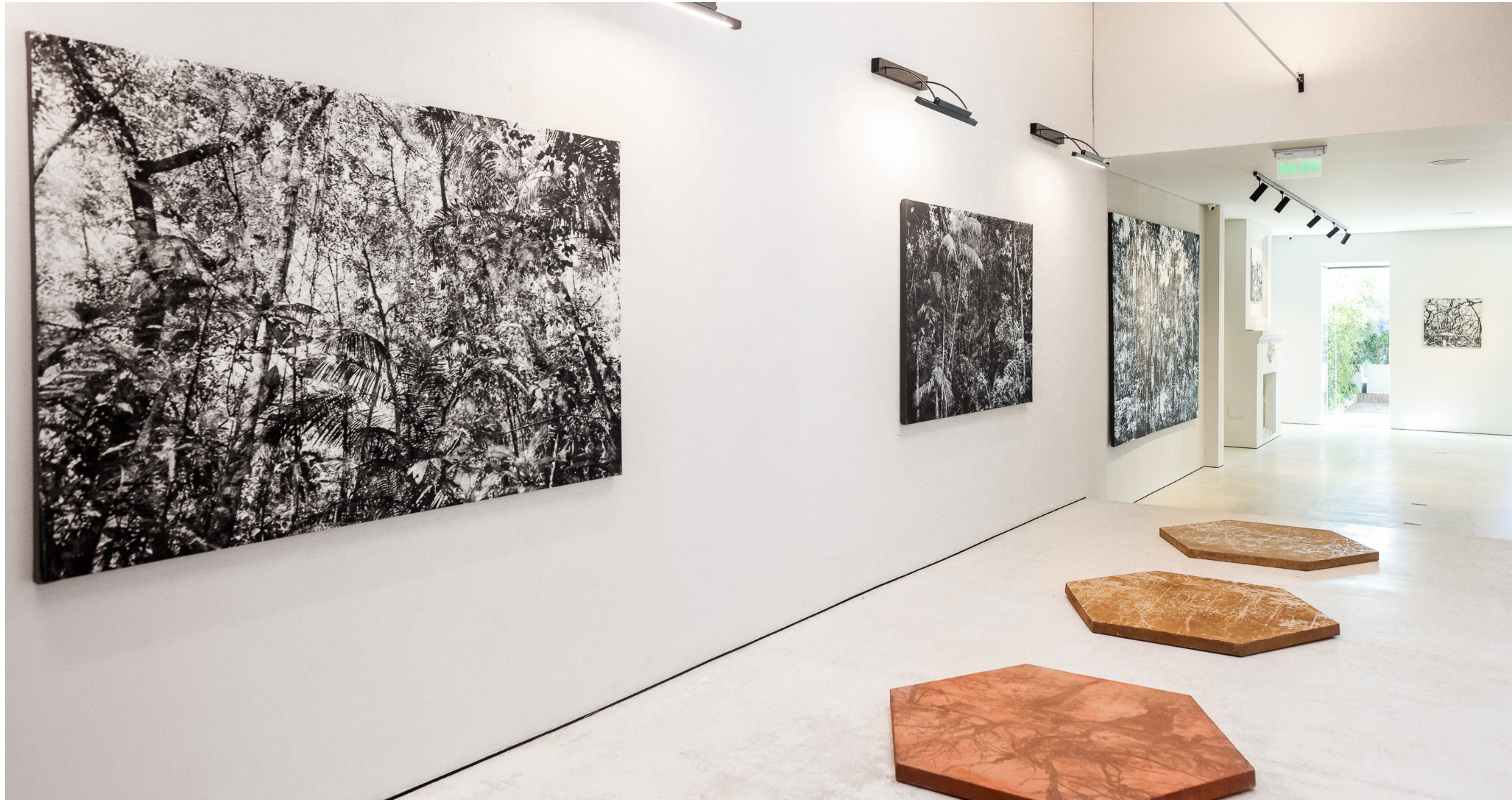
CASA MÁS - 2024