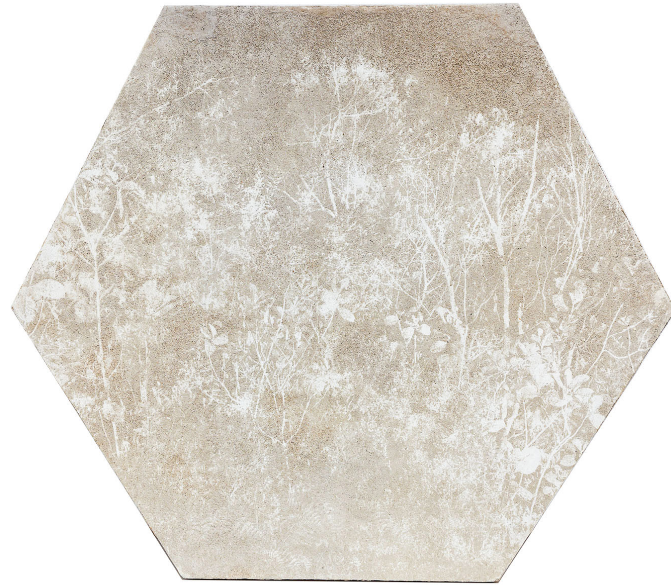
De la serie Terra Alienus Bahareque 107 x 120 cm 2023