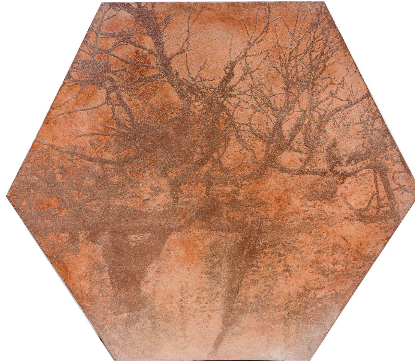
De la serie Terra Alienus Bahareque (tierra, fibras vegetales, guadua) 107 x 120 cm 2023