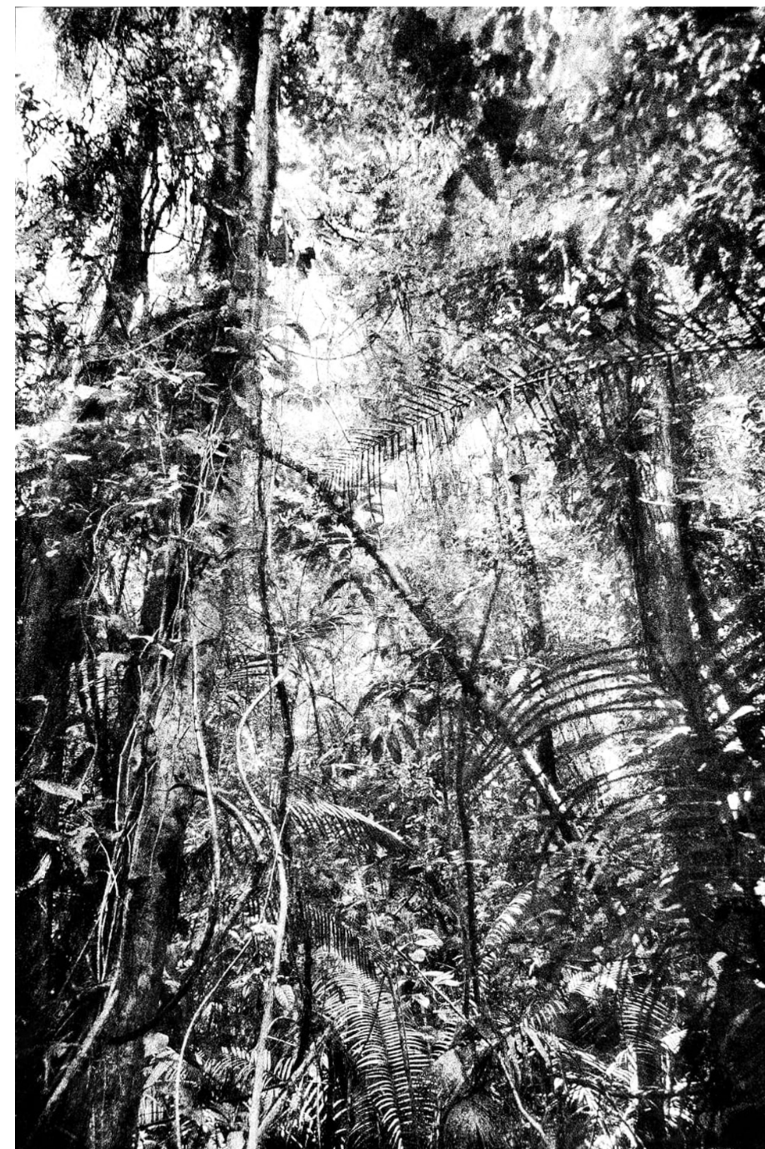
De la serie Línea Negra Pólvora sobre tela 180 x 120 cm 2023