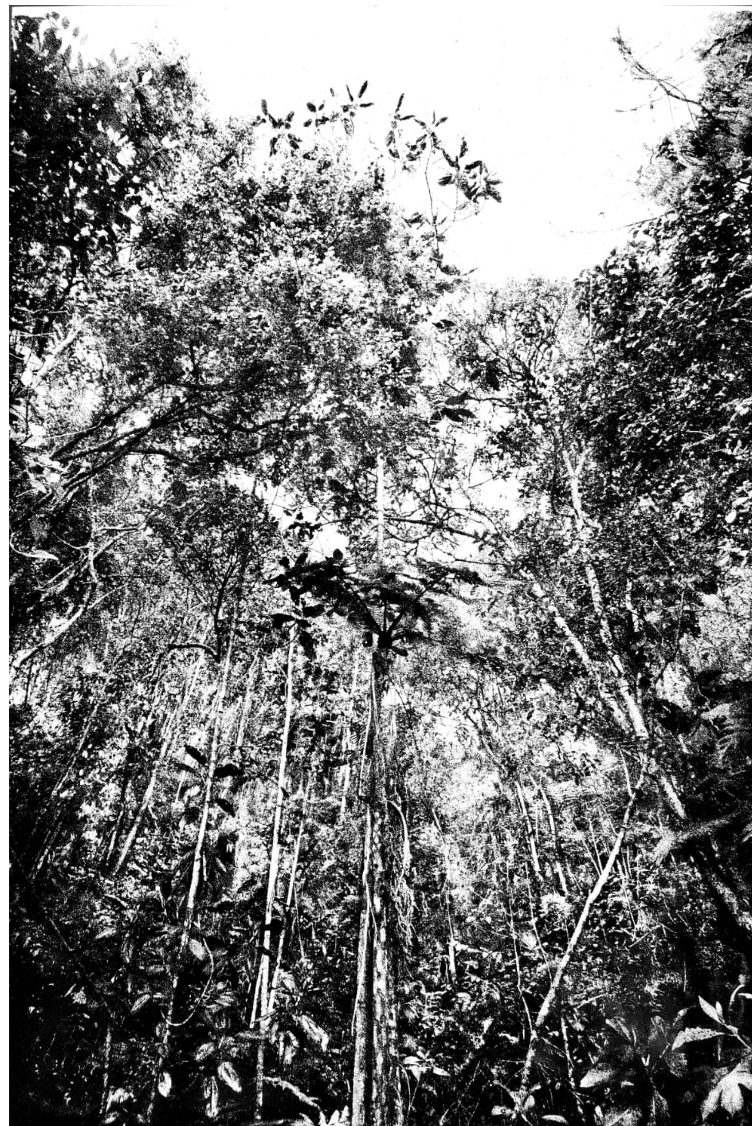
De la serie Línea Negra Pólvora sobre tela 180 x 120 cm 2023