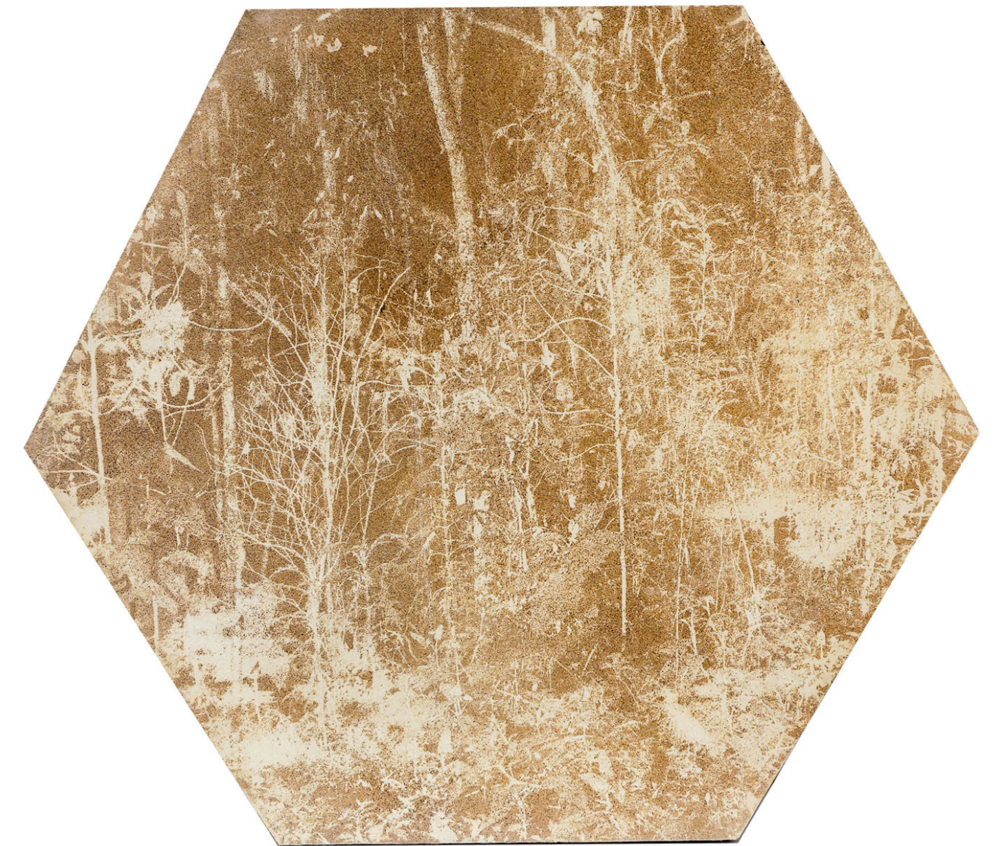
De la serie Terra Alienus Bahareque (tierra, fibras vegetales, guadua) 107 x 120 cm 2023